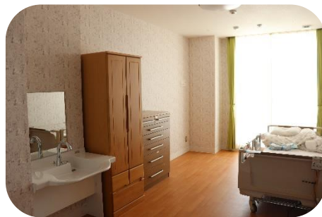
▲ 入所 居室 ▼ デイサービスフロア・お風呂